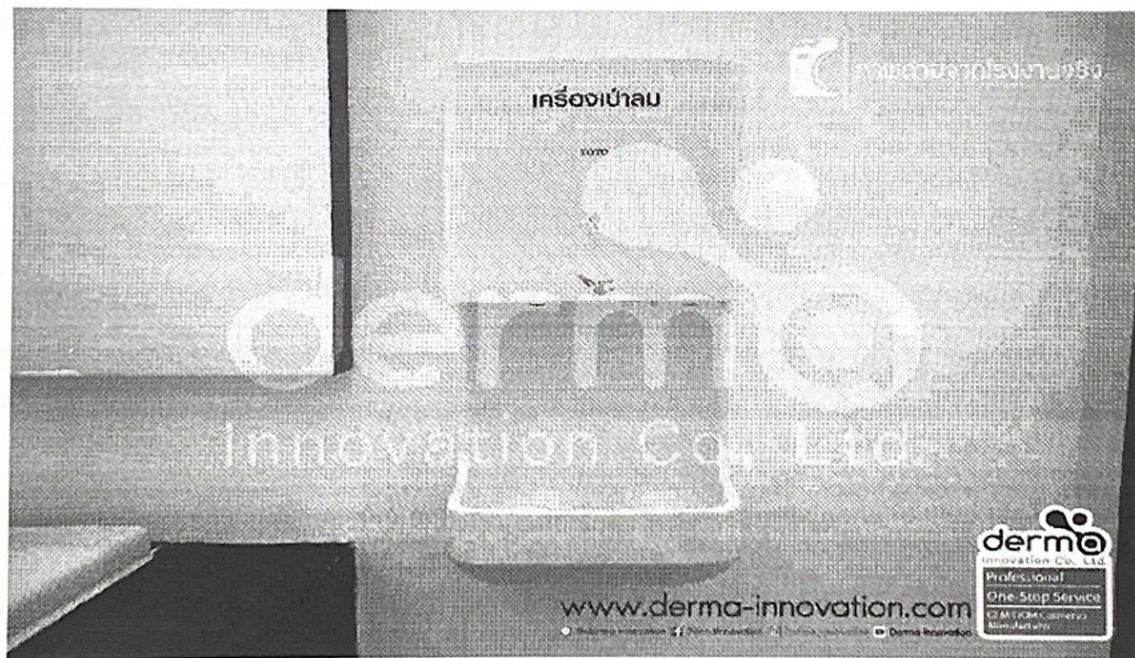
อุปกรณ์ที่ทำให้มือแห้ง เช่น เครื่องเป่าลม กระดาษทิชชู ผ้าเช็ดมือ